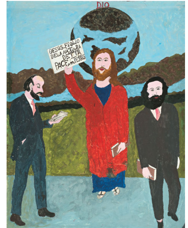
Giovanni Concettoni · Gesù figlio della natura · ohne Jahr · Tempera auf Karton · 39 x 30 cm

Pankow und andererseits um den völlig aus eigenem Impuls und seit seiner Jugend zeichnenden Art Brut -Künstler Kurt Wanski (1922–2012), der von 1971 bis zu seinem Tod im