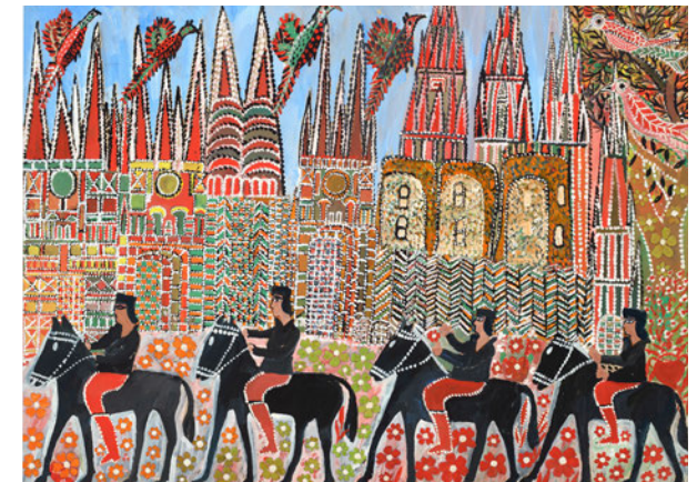
Enrico Benassi · Vier schwarze Reiter · ohne Jahr · Tempera auf Karton · 50 x 70 cm

Pankow und andererseits um den völlig aus eigenem Impuls und seit seiner Jugend zeichnenden Art Brut -Künstler Kurt Wanski (1922–2012), der von 1971 bis zu seinem Tod im