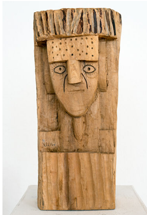
Pellegrino Vignali - La Regina - ohne Jahr · Ulmenholz · 46 x 19 x 18 cm

Mit freundlicher Unterstützung der Senatsverwaltung für Kultur und Europa, Ausstellungsfonds Kommunale Galerie