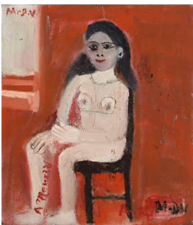
Albino Menozzi, Francesca

Bella Italia stellt rund 70 Werke von italienischen Malern aus einer privaten Sammlung vor. Sie werden zur „Primitiven Malerei“ des 20. Jahrhunderts gezählt. Die naive und feinsinnige Darstellungsweise von Mensch und Tier – in einer häufig kulissenhaften Umgebung – wirkt erzählerisch. Sie ist eine genaue Betrachtung ebenso wert, wie die Holzplastiken und das Flugobjekt, das bestaunt werden kann. Im praktischen Teil dürfen Lieblingsfiguren bestimmt, abgezeichnet und als Stabfiguren aus Pappe und farbigen Papieren gebastelt werden. Mit Farbstiften dekorieren wir anschließend die Oberflächen mit Mustern und Texturen. Der Vormittag endet mit einer kleinen Inszenierung, bei der all die schönen Figuren auftreten werden.