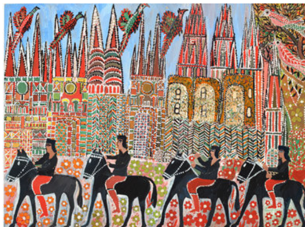
Enrico Benassi, Vier schwarze Reiter

Bitte bedenken, daß innerhalb der Ausstellung mehrere Aktdarstellungen gezeigt werden.