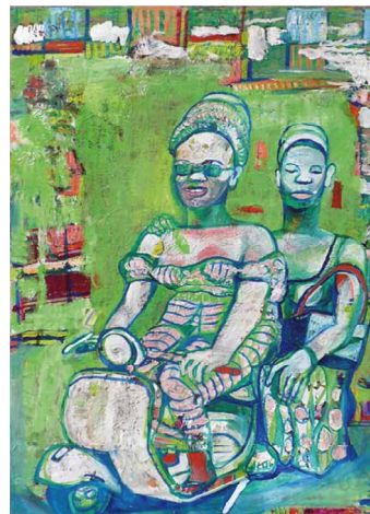
Petra Flierl, Das Moped

Veranstalter: Galerie Parterre Berlin in Kooperation mit Jugend im Museum e.V.